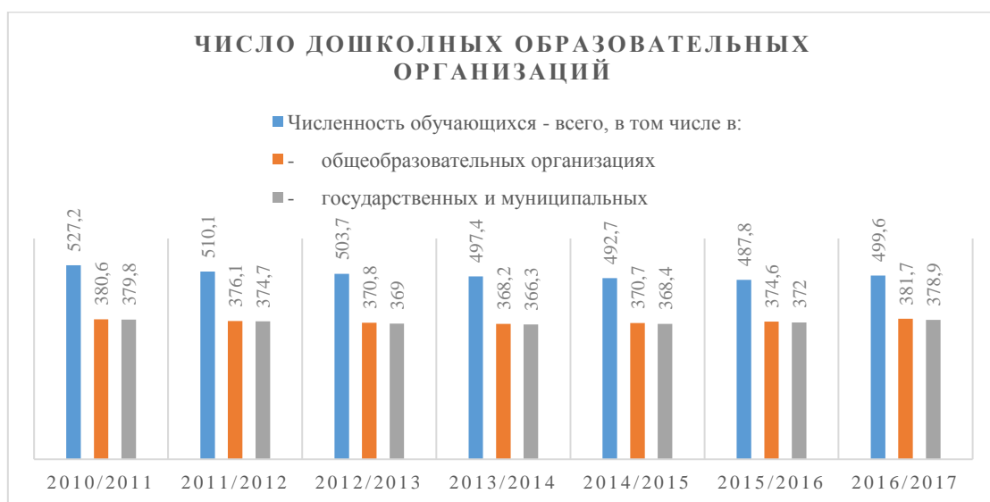
Рис. 1. Число дошкольных образовательных организаций.

Более наглядно и информативно эти данные выглядят при графическом изображении (см. рис. 1-4).