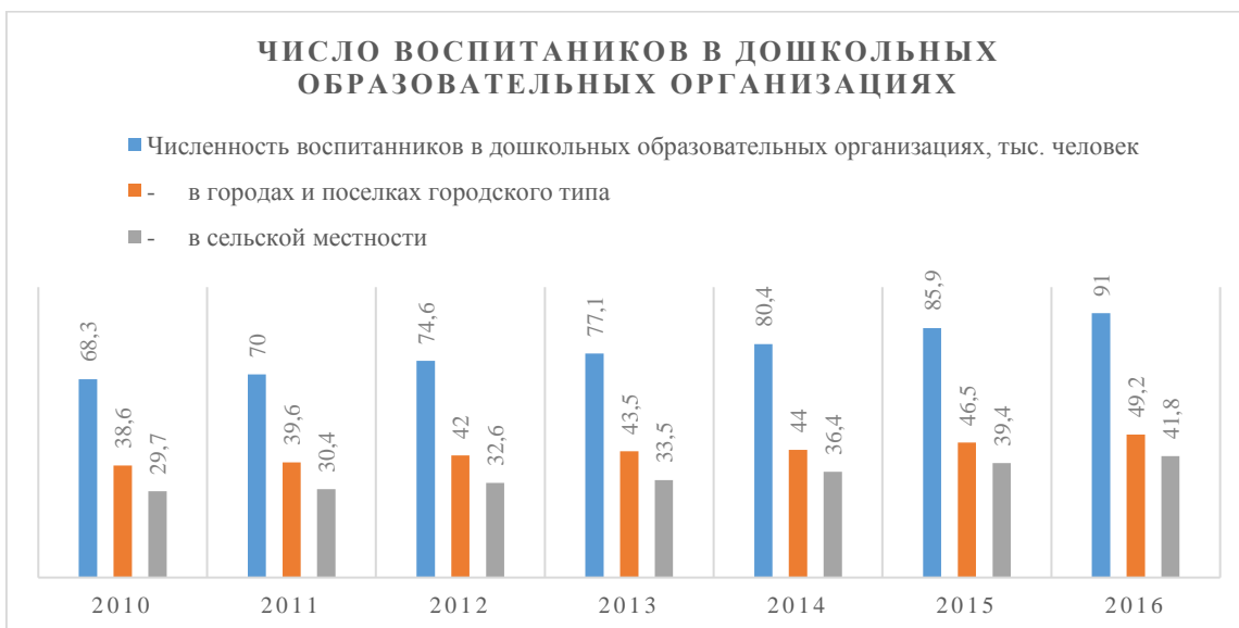
Рис. 2. Число воспитанников в дошкольных образовательных организациях.