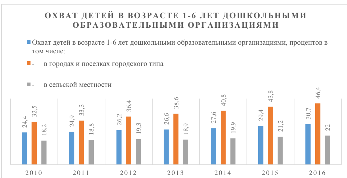
Рис. 4. Охват детей в возрасте 1-6 лет дошкольными образовательными организациями.